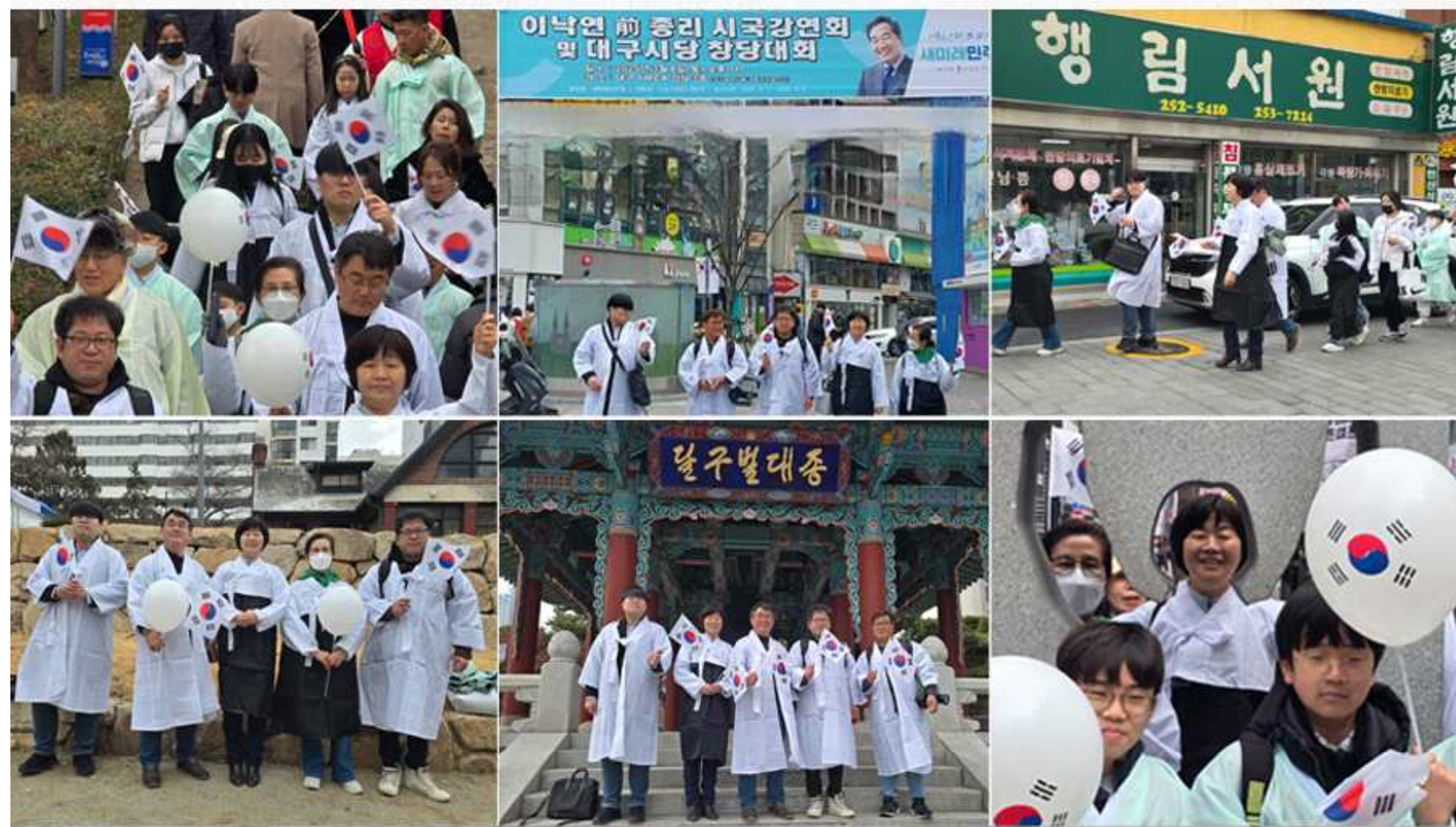
3.1절 챌린지 _ 목포에서